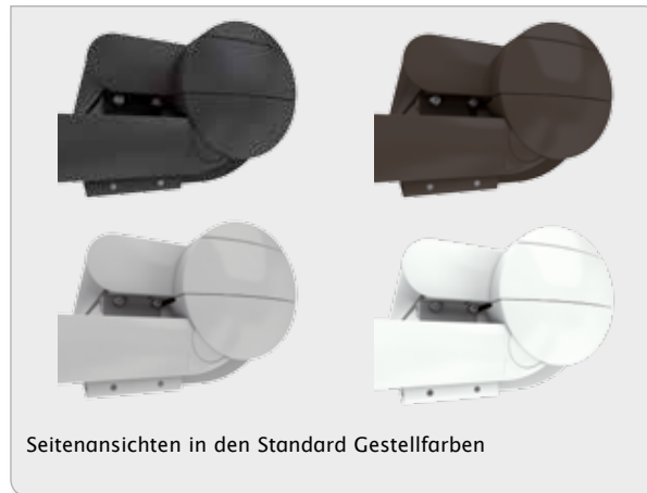
Seitenansichten in den Standard Gestellfarben

Seitenansicht mit eingerückten Führungsschienen.