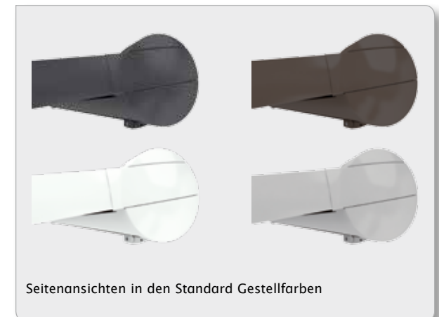
Seitenansichten in den Standard Gestellfarben

Sonderausstattungen, Gestellfarben und technische Details ab Seite 44.